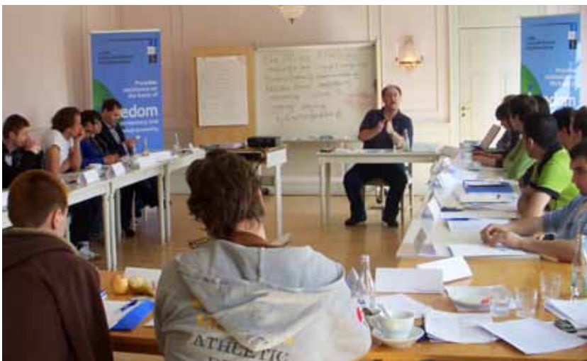
Nigel Ashford diskuterar ideologi med ungdomar från östra Europa och Kaukasus under Summer School på Muskö.

Hjalmarsonstiftelsen arrangerar skribentutbildningar för utrikespolitiskt intresserade skribenter. Varje kurs består av tre delar under en period av cirka ett år: Två helger och en heldag i Stockholm. Under kurserna varvas teori med praktiska skrivövningar. Inbjudna talare ger utrikespolitiska analyser och delar med sig av sina erfarenheter.