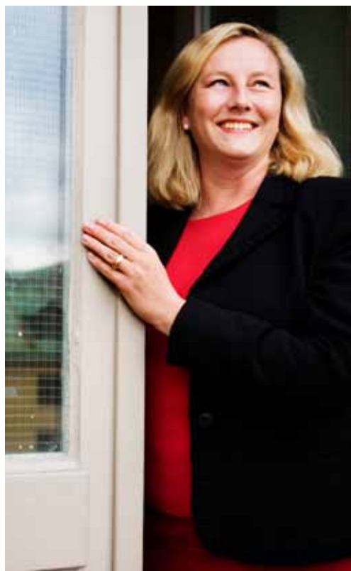
Handelsminister Ewa Björling

Vid en granskning av var välståndet ökat mest under senare år framgår att det finns en