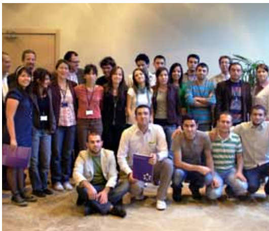
Deltagare i en ungdomskonferens om ideologi i Ankara, Turkiet.