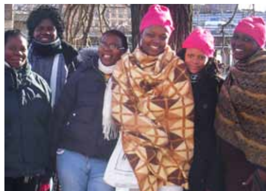
Kvinnor från Tanzania, Uganda och Seychellerna besökte Stockholm i mars 2009 för utbildning.