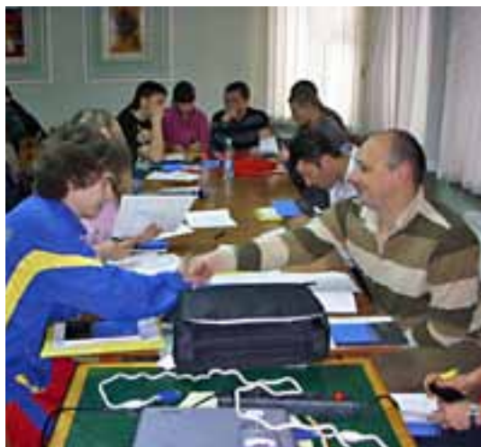
I Ukraina har JHS i samarbete med Youth of Our Ukraine skapat en ungdomsutbildning i fyra steg.

6-7 november inleddes en ny omgång av trestegsutbildningen för ungdomar på temat Kroatien och EU. Konferenserna syftar till att ge unga politiker de färdigheter som kommer att krävas efter det att Kroatien gått med i EU, och har tidigare genomförts med mycket lyckat resultat.